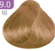
VERY LIGHT BLONDE بلوند خیلی روشن