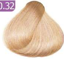
PLATINUM BEIGE BLONDE بلوند بژ پلاتینه