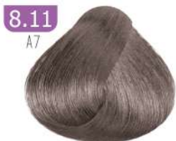
8.11 A7 LIGHT ASH BLONDE بلوند خاکستری روشن