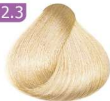
GOLDEN HIGHLIGHT هایلیت طلایی