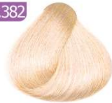
HONEY MILK شیر عسلی