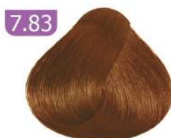
7.83 MEDIUM TOBACCO BLONDE بلوند تنباکویی متوسط