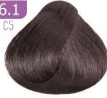
DARK SMOKY BLONDE بلوند دودی تیره