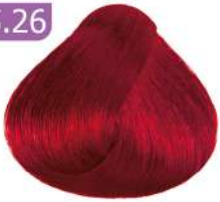
MEDIUM RED VIOLET شرابی قرمز متوسط