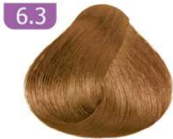
6.3 DARK GOLDEN BLONDE بلوند طلایی تیره