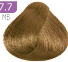
MEDIUM MATT BLONDE بلوند زیتونی متوسط