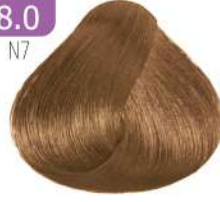
LIGHT BLONDE بلوند روشن