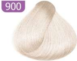
900 EXTRA LIGHT BLONDE بلوند فوق العاده روشن