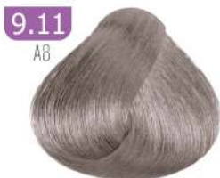
9.11 A8 VERY LIGHT ASH BLONDE بلوند خاکستری خیلی روشن