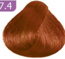
MEDIUM COPPER BLONDE بلوند مسی متوسط