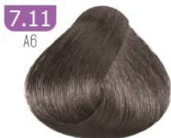
7.11 A6 MEDIUM ASH BLONDE بلوند خاکستری متوسط