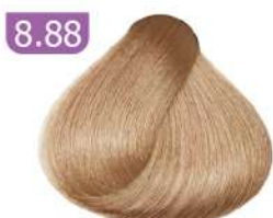
8.88 LIGHT CAPPUCCINO BLONDE بلوند کاپوچینو روشن