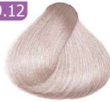
VERY LIGHT SMOKY VIOLET BLONDE بلوند دودی بنفش خیلی روشن