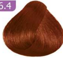
DARK COPPER BLONDE بلوند مسی تیره