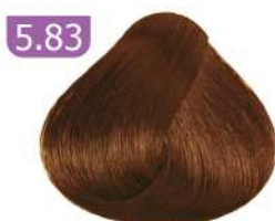
5.83 LIGHT TOBACCO BROWN قهوه ای تنباکویی روشن