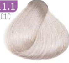
ULTRA LIGHT SMOKY BLONDE بلوند دودی خیلی خیلی روشن