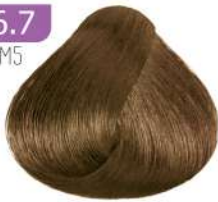
DARK MATT BLONDE بلوند زیتونی تیره