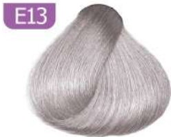
E13 SILVER MIXTONE واریاسیون نقره ای