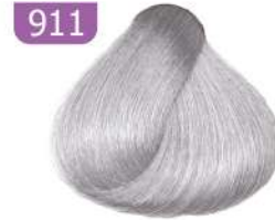
911 ASH SILVER نقره ای خاکستری