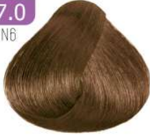
MEDIUM BLONDE بلوند متوسط