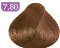
7.80 MEDIUM NESCAFE BLONDE بلوند نسکافه ای متوسط