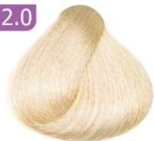
NATURAL HIGHLIGHT هایلیت طبیعی