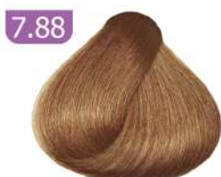
7.88 MEDIUM CAPPUCCINO BLONDE بلوند کاپوچینو متوسط