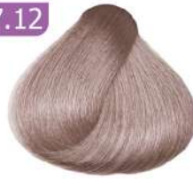
MEDIUM SMOKY VIOLET BLONDE بلوند دودی بنفش متوسط