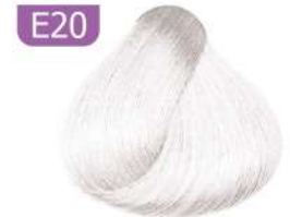
E20 LIGHTENER روشن کننده