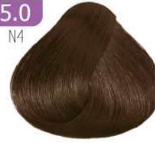
LIGHT BROWN قهوه ای روشن