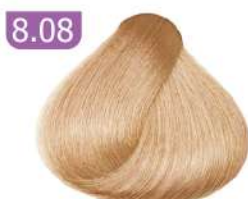
8.08 LIGHT CARAMEL BLONDE بلوند کاراملی روشن