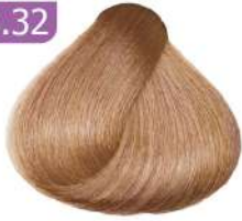
LIGHT BEIGE BLONDE بلوند بژ روشن