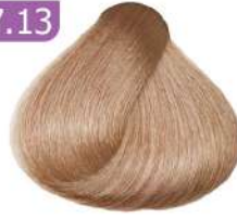
MEDIUM SANDY BLONDE بلوند شنّی متوسط