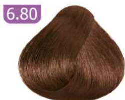
6.80 DARK NESCAFE BLONDE بلوند نسکافه ای تیره