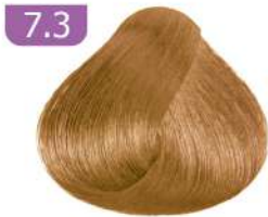
7.3 MEDIUM GOLDEN BLONDE بلوند طلایی متوسط