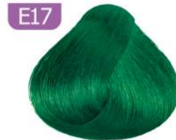
E17 ANTI RED MIXTONE واریاسیون سبز