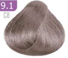
VERY LIGHT SMOKY BLONDE بلوند دودی خیلی روشن