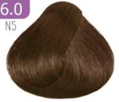
DARK BLONDE بلوند تیره