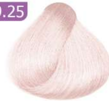
YELLOWISH PINK (ROSEGOLD) رز کلد (کلبهی)