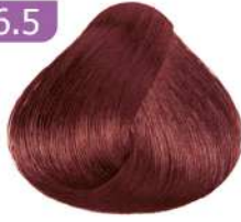
DARK MAHOAGANY BLONDE بلوند ماهاکونی تیره