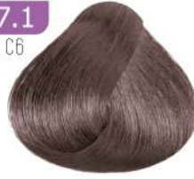
MEDIUM SMOKY BLONDE بلوند دودی متوسط