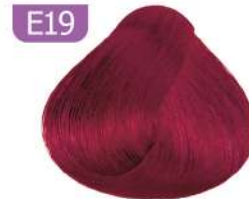
E19 RED BLUE MIXTONE واریاسیون سرخ آبی