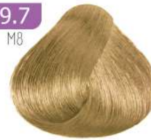
VERY LIGHT MATT BLONDE بلوند زیتونی خیلی روشن