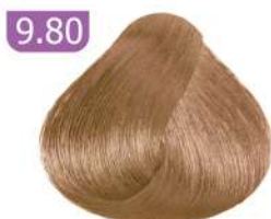
9.80 VERY LIGHT NESCAFE BLONDE بلوند نسکافه ای خیلی روشن