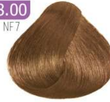
EXTRA LIGHT BLONDE بلوند روشن اکسترا