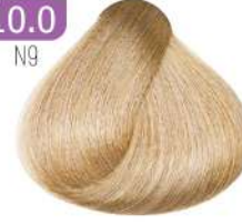
PLATINUM BLONDE بلوند پلاتینه