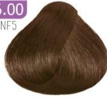
EXTRA DARK BLONDE بلوند تیره اکسترا