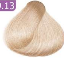
VERY LIGHT SANDY BLONDE بلوند شنّی خیلی روشن