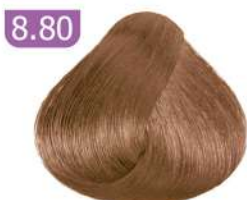
8.80 LIGHT NESCAFE BLONDE بلوند نسکافه ای روشن