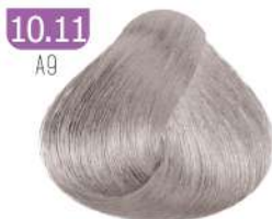
10.11 A9 PLATINUM ASH BLONDE بلوند خاکستری پلاتینه