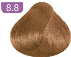
8.8 LIGHT CHOCOLATE BLONDE بلوند شکلاتی روشن