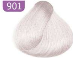
901 EXTRA LIGHT ASH BLONDE بلوند خاکستری فوق العاده روشن