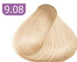
9.08 VERY LIGHT CARAMEL BLONDE بلوند کاراملی خیلی روشن