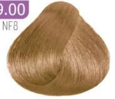
EXTRA VERY LIGHT BLONDE بلوند خیلی روشن اکسترا