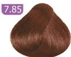
7.85 MEDIUM COCOA BLONDE بلوند کاکائویی متوسط