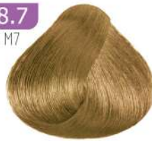
LIGHT MATT BLONDE بلوند زیتونی روشن