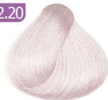
SHELLI VIOLET صدفی بنفش