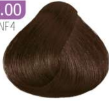
EXTRA LIGHT BROWN قهوه ای روشن اکسترا