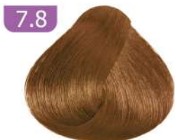
7.8 MEDIUM CHOCOLATE BLONDE بلوند شکلاتی متوسط