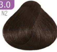
DARK BROWN قهوه ای تیره