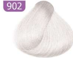
902 SUPER ICE سوپر یخی