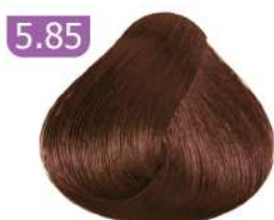
5.85 LIGHT COCOA BROWN قهوه ای کاکائویی روشن