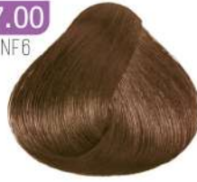
EXTRA MEDIUM BLONDE بلوند متوسط اکسترا