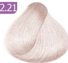
PEARL HIGHLIGHT هایلیت مرواریدی