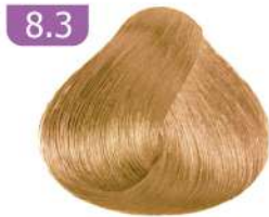
8.3 LIGHT GOLDEN BLONDE بلوند طلایی روشن