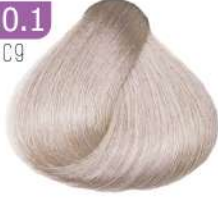
PLATINUM SMOKY BLONDE بلوند دودی پلاتینه