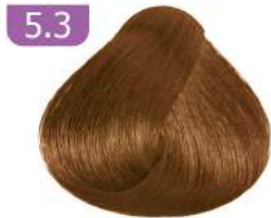
5.3 LIGHT GOLDEN BROWN قهوه ای طلایی روشن