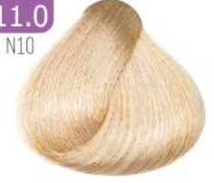
ULTRA LIGHT BLONDE بلوند خیلی خیلی روشن