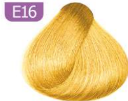
E16 GOLDEN MIXTONE واریاسیون طلایی