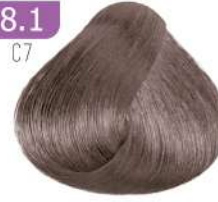
LIGHT SMOKY BLONDE بلوند دودی روشن