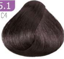
LIGHT SMOKY BROWN قهوه ای دودی روشن