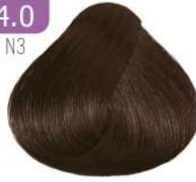
MEDIUM BROWN قهوه ای متوسط