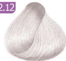
SILVER HIGHLIGHT هایلیت نقره ای