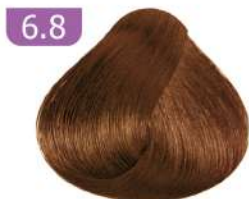
6.8 DARK CHOCOLATE BLONDE بلوند شکلاتی تیره