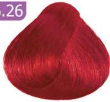
LIGHT RED VIOLET شرابی قرمز روشن